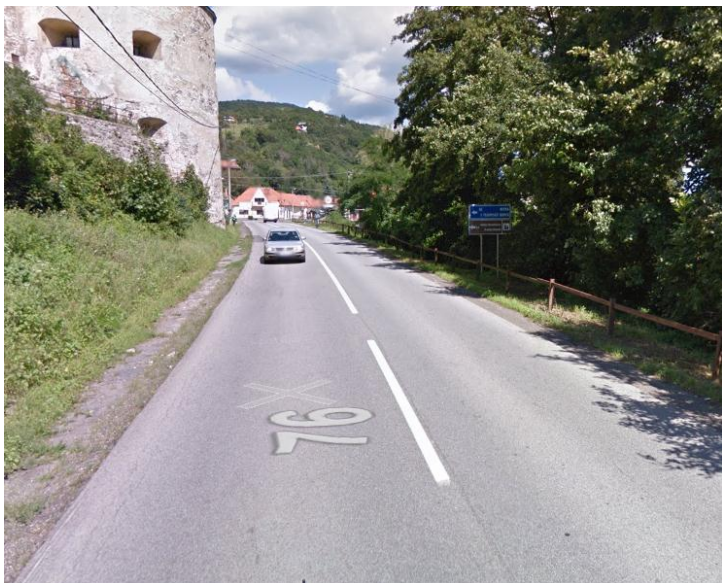
KNL v smere staničenia