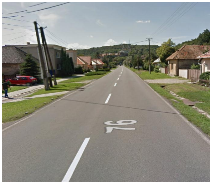
KNL proti smeru staničenia