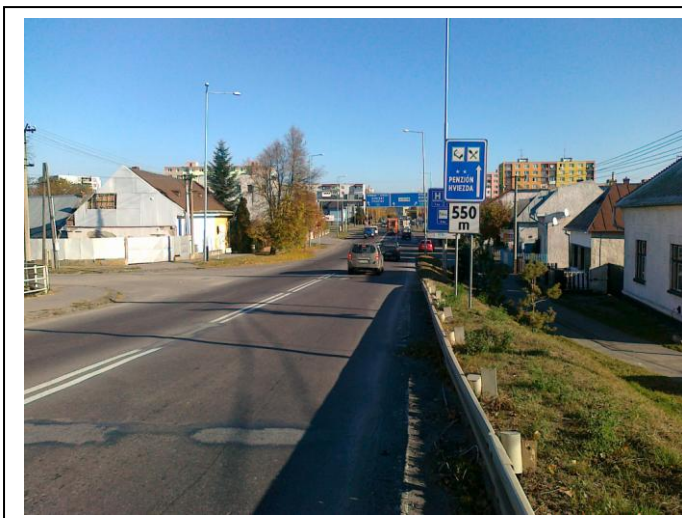
Koniec úseku KNL proti smeru staničenia